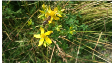
Heilpflanzen: Johanniskraut und