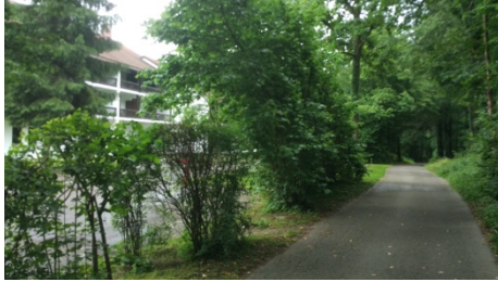
Startpunkt: Hotel St. Georg, Ghersburgstraße 18, Bad Aibling