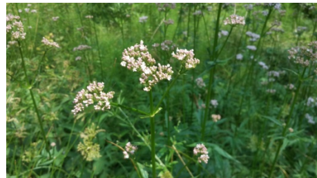
echter Arznei-Baldrian, Beruhigung für Körper und Psyche